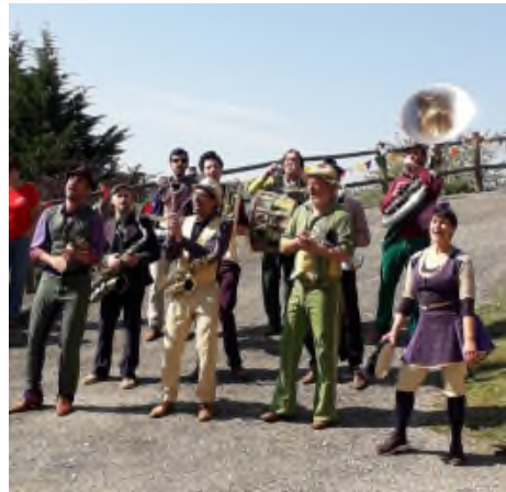
Fanfare des "Po'Boys"

de la fanfare des "Po'Boys". La mini chasse aux œufs, les ateliers maquillage et confection de paniers ont fait le bonheur des petits et des grands gourmands.